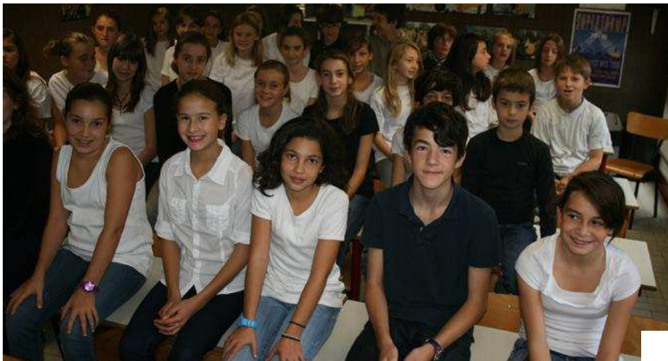
La chorale de Saint-Joseph regroupe les élèves de la 6 e à la 3 e.

Don d'organes. L'association « S'unir pour sauver » a voulu, par une chanson, rendre hommage à un ancien élève de Saint-Joseph devenu chirurgien, décédé dans un accident d'avion lors d'une mission de greffe d'organe.